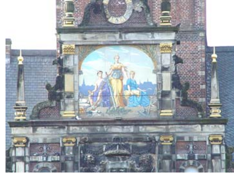
De lavasteen uitvoering op de waag

Het tegeltableau op de waag is uitgevoerd in geëmailleerd lavasteen. Na het verschijnen van het artikel kwam de vraag bij ons binnen of dit dan wel keramiek is. Bij de daarna gestarte speurtocht naar het antwoord kwam de volgende informatie boven tafel.