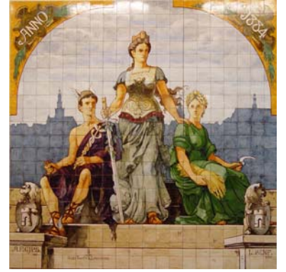
De keramische uitvoering

In een Frans patent, gepubliceerd 30 november 1909 wordt een proces beschreven voor het duurzaam beschilderen van leisteen. De daarbij gebruikte lakken werden na het opbrengen in een openluchtoven verhit van 45° tot 65° en na 24 uur uit de oven gehaald en gekoeld. Daarna werd een tweede transparante laag aangebracht die eveneens weer 12 uur in de oven werd geplaatst en na afkoeling werd gepolijst. Het methode hierboven wordt beschreven als emaileren.